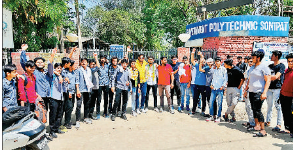
सोनीपत। नवनियुक्त पदाधिकारियों का स्वागत करते हुए।