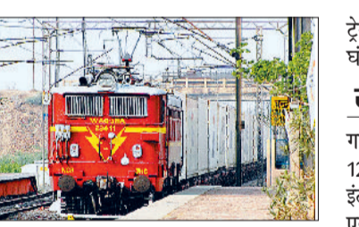
ट्रेनों के रद्द रहने से यात्रियों को दूसरी ट्रेनों के लिए घंटों इंतजार करना पड़ा।

संयुक्त किसान मोर्चा (अराजनैतिक) के आह्वान पर अंबाला में किसान रेलवे ट्रैक जाम कर बैठे हुए हैं। जिससे रेलवे यातायात बुरी तरह प्रभावित है। शनिवार को चौथे दिन भी ट्रेनों के रद्द किए जाने का सिलसिला जारी रहा। बठिंडा एक्सप्रेस सहित अप व डाउन लाइन की 12 ट्रेनें रद्द रही, वहीं छह जोड़ी ट्रेनों के मार्ग में परिवर्तन किया गया है। जिससे यात्रियों को परेशानियों का सामना करना पड़ा।