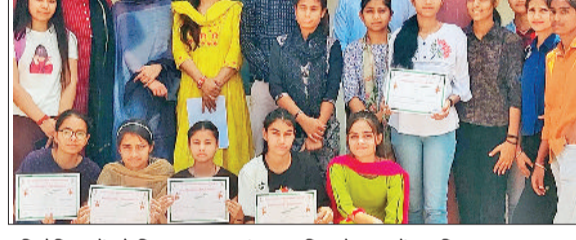
प्रतियोगिताओं को विजता छात्र प्रशंसा पत्र दिखाते साथ में महाविद्यालय का स्टाफ।