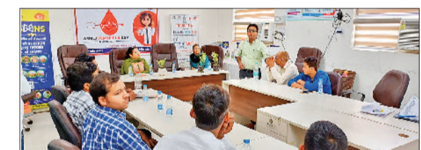
सोनीपत। आयोजित सेमिनार के दौरान मौजूद स्वास्थ्य कर्मी।