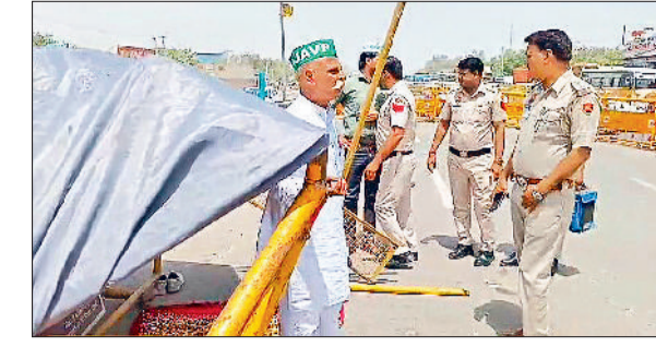
सोनीपत। प्रदर्शन स्थल पर पहुंचे पुलिस अधिकारी।