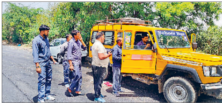
सोनीपत। वाहनों की जांच करते विभाग के अधिकारी।

सुरक्षित स्कूल वाहन नीति के तहत क्षेत्रीय परिवहन प्राधिकरण ने सेक्टर-3 में की स्कूल वाहनों की जांच अधिकतर वाहन मिले ओवर स्पीड कई में नहीं मिला जीपीएस