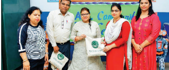
सोनीपत। कार्यक्रम के दौरान अतिथियों का स्वागत करते स्टाफ।