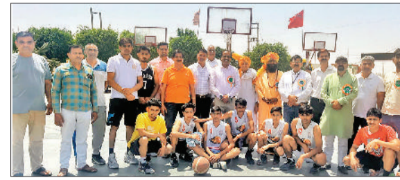
सोनीपत। विजेताओं को सम्मानित करते हुए स्कूल चेरमैन एवं अन्य।